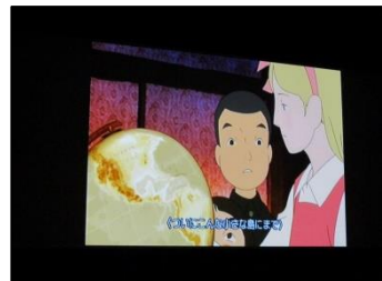
映画「ジョパンニの島」