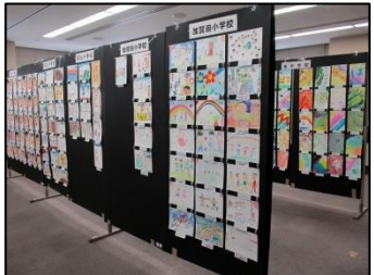
人権ポスター作成展示