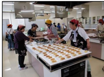
食工房（茶がゆ・三笠焼）