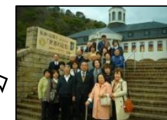
写真は前年度「鳴門市ドイツ館」にて ☆