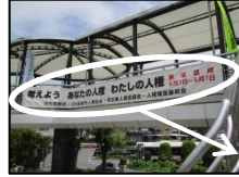
歩道橋手すりに設置