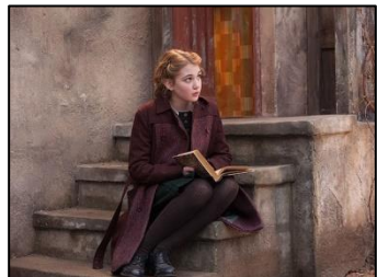
映画「やさしい本泥棒」