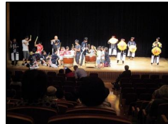
和太鼓（河南高校地車）