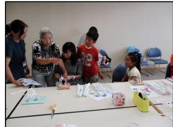
布ぞうり作り体験