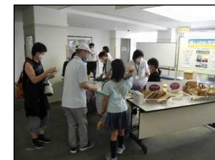
※(写真は2022年のものです)

■愛・いのち・平和展 於：キックス 7月21日(金)22日(土)午前10時~午後4時 今年もみんなが楽しみながら、人権と平和の大切さを学んでもらえるようなイベントを、企画中です。