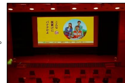
※(写真は2022年のものです)

■「夏休み平和施設見学会」 8月中旬 小学4~6年生を対象に、人権・平和関連施設を見学し、人権・平和の大切さを学んでもらいます。見学施設などは現在検討中です。