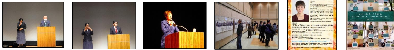
※人権啓発映像「わたしは今、こう思う。」を初紹介