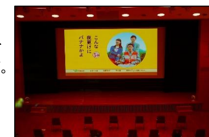
※(写真は2022年のものです)

■「夏休み平和施設見学会」 8月中旬 小学4~6年生を対象に、人権・平和関連施設を見学し、人権・平和の大切さを学んでもらいます。見学施設などは現在検討中です。