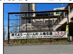
駅前ロータリー（横断幕と幟）

河内長野・三日市町両駅前ロータリーに啓発横断幕を設置、市の公用車にマグネットステッカーを貼付。