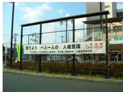
三日市町駅前ロータリー

■人権週間啓発：河内長野・三日市町両駅前ロータリーに啓発横断幕を設置し、市の公用車にマグネットステッカーを貼付（12月2日～11日）。市民サロンにて人権作文・ポスターの展示やDVDを上映。