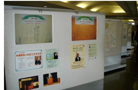
市役所市民サロンでの展示