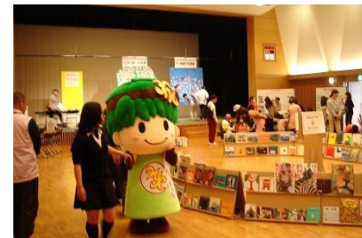
親力UP子育て孫育てフェスタ