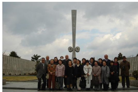
太平洋戦全国戦災都市空爆戦没者慰霊塔

：3月4日、姫路市平和資料館（太平洋戦全国戦災都市空爆戦没者慰霊塔）他を訪問見学しました。都市空襲に関する様々な資料を目の当たりにして、あらためて「平和」への想いを実感しました。