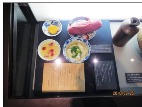
ピースおおさか館内展示物（戦時中の食物・焼夷弾のレプリカ）