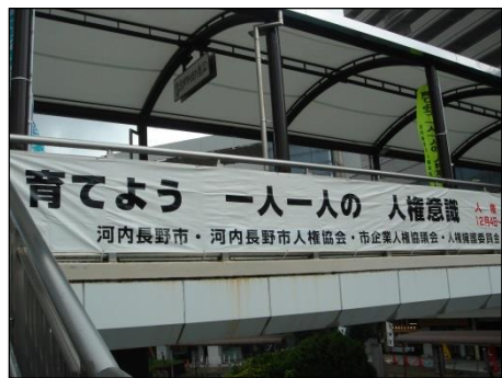
河内長野駅前陸橋

■人権週間啓発：河内長野・三日市町両駅前ロータリーに啓発横断幕を設置し、市の公用車にマグネットステッカーを貼付（12月3日～11日）。市民サロンにて人権作文・ポスターの展示を行いました。