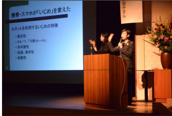
スライドショーを使用した講演